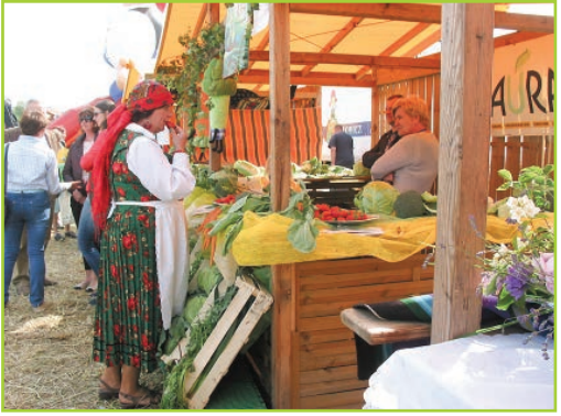
Promocja produktów tradycyjnych i rolniczych

wprowadzenie wirusa ASF następuje poprzez transport, mięso, produkty mięsne, odpadki poubojowe i kuchenne pochodzące od chorych świń i dzików. Kolejne postulaty to przeprowadzenie kontroli weterynaryjnej importowanych do naszego kraju, w dużych ilościach, prosiąt i warchlaków oraz wyjaśnienie przyczyn różnic w cenach (czy nie są dumpingowe) wieprzowiny niemieckiej czy duńskiej na giełdach UE, a cenach półtuszy importowanych na rynek polski.