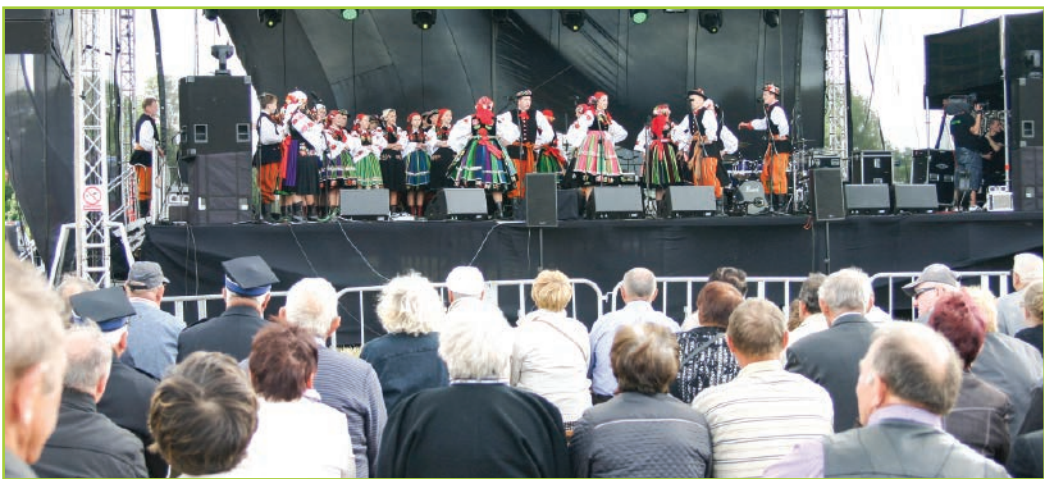
Promocja marki „Rolnictwo energią regionu łódzkiego” w Nowych Zdunach

Izba Rolnicza Województwa Łódzkiego już po raz drugi, jako partner merytoryczny VII Forum Gospodarczego odbywającego się w dniu 15-16 października w Łodzi, mogła zaprosić na salon branżowy – „Innowacyjne rolnictwo i przetwórstwo rolno-spożywcze”, który został objęty patronatem Ministra Rolnictwa i Rozwoju Wsi, a także Stowarzyszenia Eksporterów Polskich. W tym roku zakres spotkania ze względu na embargo miał charakter szcze-