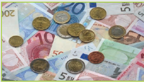
Dopłaty bezpośrednie - str. 4