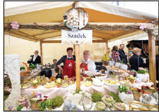
Stoisko Koła na Turnieju Sołectw w Szadku

Pomysłów członkiniom Koła nie brakuje. Naszym celem jest rozwój naszego miasteczka i propagowanie kultury i tradycji województwa łódzkiego. Marzy nam się stworzenie muzeum historii Szadku i wytyczanie w naszej okolicy kolejnych ścieżek rowerowych. Dzięki bardzo zgrannemu, wesołemu i prężnemu zespołowi pokazujemy, że życie w małym miasteczku może być ciekawe i inspirujące.