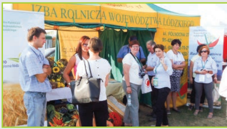
O Izbie Rolniczej Województwa Łódzkiego – str. 2 i 3